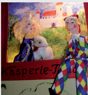
Kasperle-Theater mit Gitti Kurz