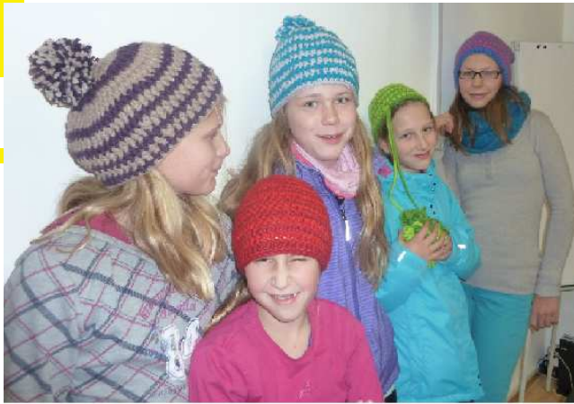
Mützen-Häkelforkshop im Häkel- und Strickcafé